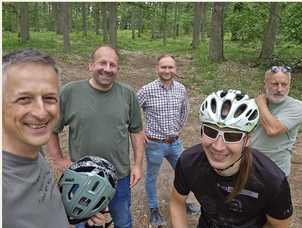
Spotkania z mieszkańcami, samorządami i aktywistami – proces dialogu, marzec-maj 2024

Rozmowa o lesie społecznym nie zaczyna się od technologii cięć Zaczyna się od zrozumienia, jaką rolę dany las pełni dla ludzi, krajobrazu i jakości życia