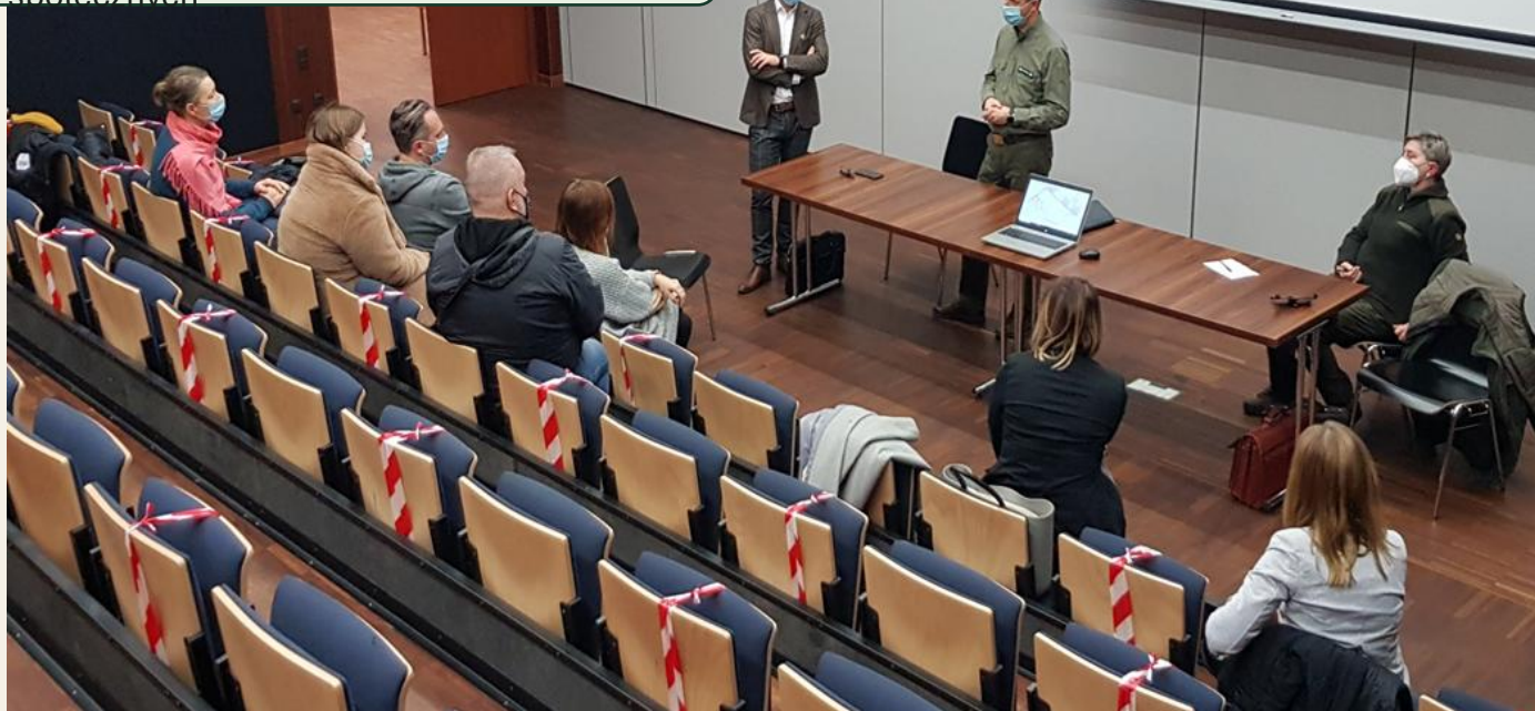
Spotkania z mieszkańcami, samorządami – proces dialogu, rok 2021

Zmiany rębni i korekty planów prac w kompleksach intensywnie użytkowanych przez mieszkańców wprowadzono jeszcze przed formalnym pilotażem lasów społecznych